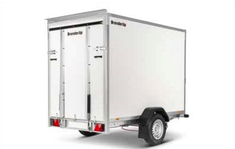
7260 B MIT RAMPE