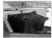
Mit angebaute Werkzeugkiste auf der Deichsel.