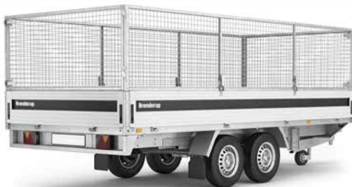
5375 A ABBILDUNG ZEIGT ZUBEHÖR MIT LAUBGITTERAUFSATZ

Weitere Informationen finden Sie auf Seite 43-44 oder unter www.brenderup.de