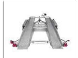
Heckansicht in angekippter Position