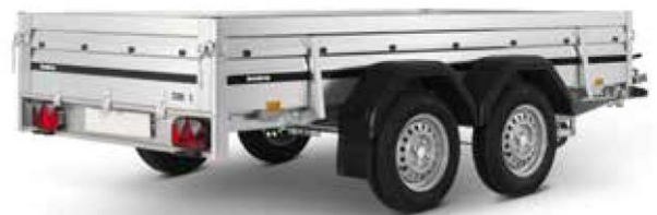
2300 S TANDEM