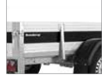
40 cm hohe Bordwände für mehr Volumen.