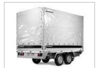
Hochplane mit Gestell