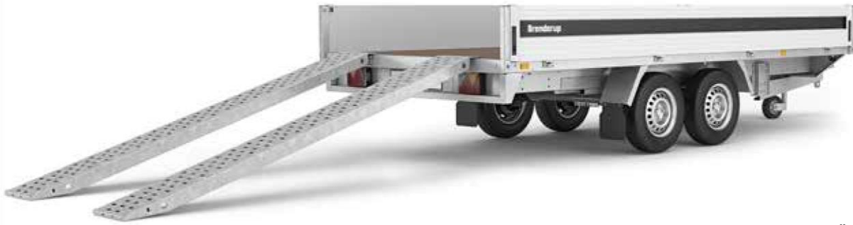
5520 A ABBILDUNG ZEIGT ZUBEHÖR MIT AUFFAHRAMPEN STAHL