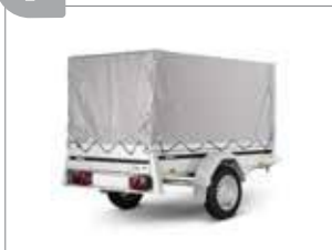
Hochplane mit Gestell