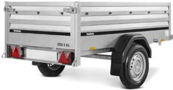
1205 S XL