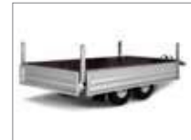
Mit abklappbarer Frontklappe (3250) oder komplett abklappbare Bordwände (3251).