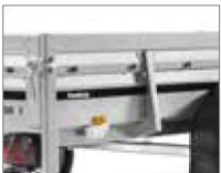
40 cm hohe Bordwände für mehr Volumen.