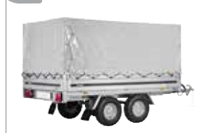
Hochplane mit Gestell