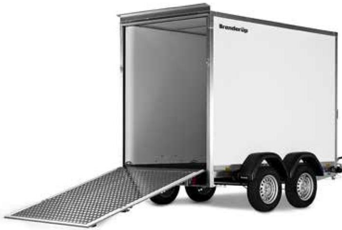
7300 TB MIT RAMPE

Weitere Informationen finden Sie auf Seite 33-34 oder unter www.brenderup.de