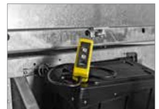
Bedienelement für E-Pumpe