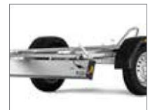
Die Lichtleiste ist kippbar für das Auf- und Abladen.

Der MC 2 – Motorradfahrer schätzen den niedrigen Schwerpunkt und die idealen Fahreigenschaften. Brenderup verwendet nur die besten Qualitätsbestandteile wie Lampen, Achsen, Kupplung usw. Das Chassis ist verschweißt und feuerverzinkt.