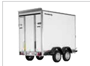
7350 TB mit Rampe