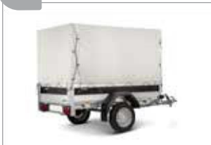
Hochplane mit Gestell