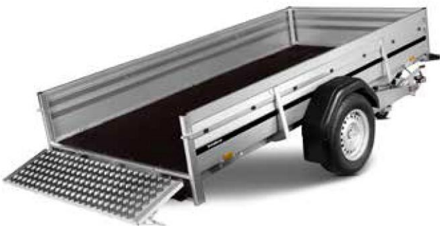
2300 S ANKIPPBAR

Weitere Informationen finden Sie auf Seite 43-44 oder unter www.brenderup.de