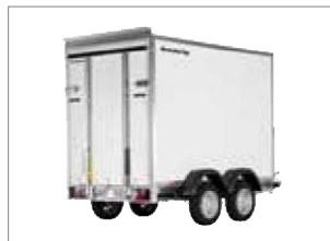
7350 TB mit Rampe