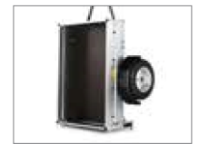
Kann hochkant gelagert werden.