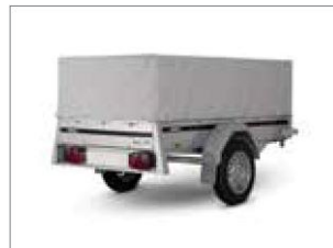
Überzugplane für Laubgitteraufsatz