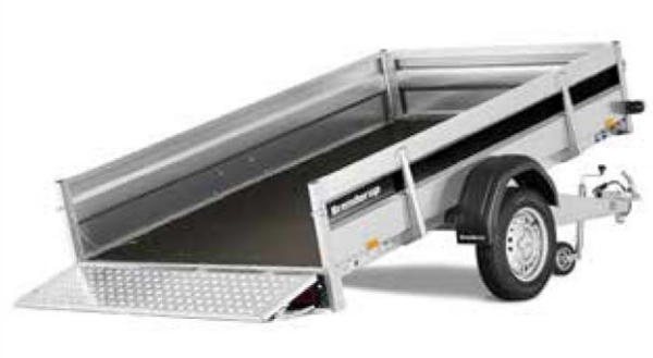
2260 S ANKIPPBAR