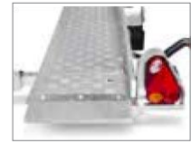
Detailansicht hinten rechts.