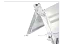
Mit oberer und