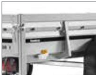
40 cm hohe Bordwände für mehr Volumen, Vorderwand klappbar