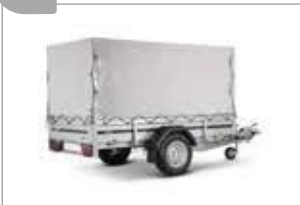
Hochplane mit Gestell