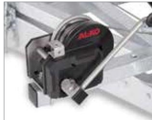
Standardausstattung Winde mit Seil