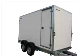
Tür in der Seite