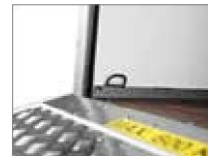
integrierte Verzurr- möglichkeiten