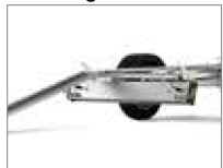
Die Rampe ist schnell versetzbar.