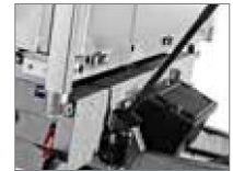
Die hydraulische Kippfunktion ist Standard.