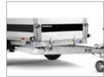
abklappbare Bordwände vorne